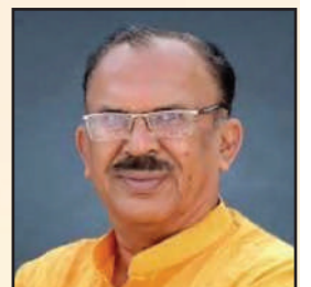
वासुदेव देवनानी अध्यक्ष, राजस्थान विधानसभा