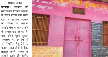
वीडियो और शिकायतों ने बड़ा प्रशासन की मुश्किलें

झाड़ोल के माणस गांव में राशन वितरण पर उठे गंभीर सवाल लाइसेंस निलंबन और एफआईआर की मांग तेज